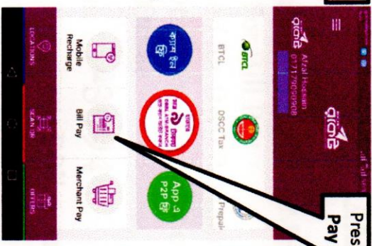
Step - 2