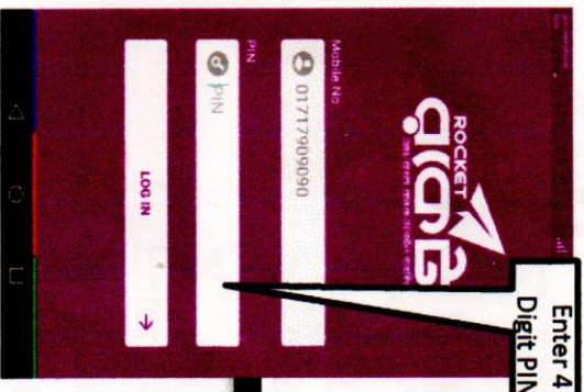
Step - 1