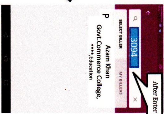
Step - 4