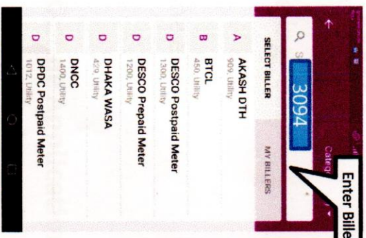
Step - 3